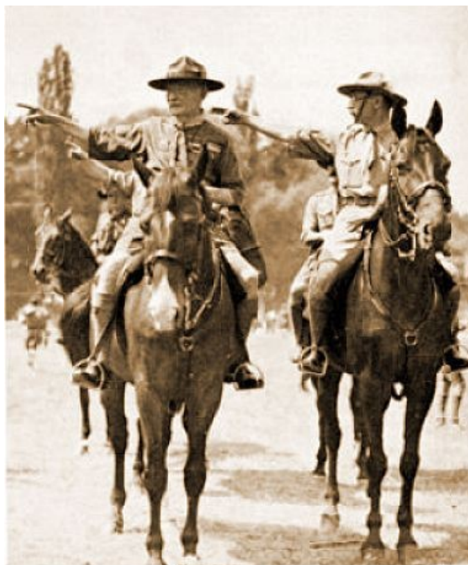
A népszerű Bi-Pi Telekivel