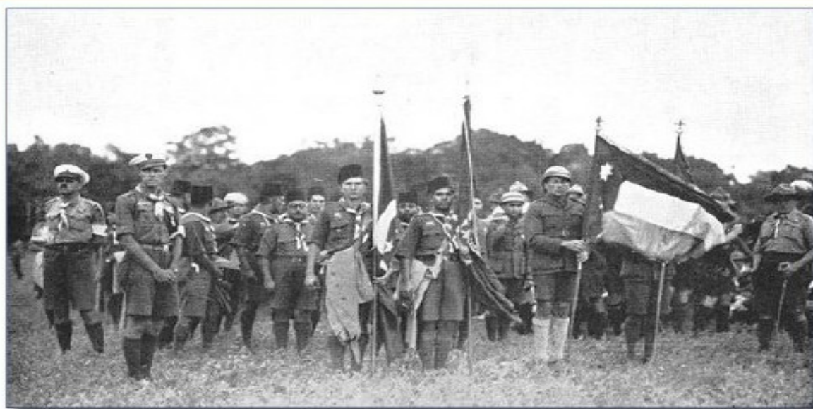
Egyptian & Iraqi Scouts